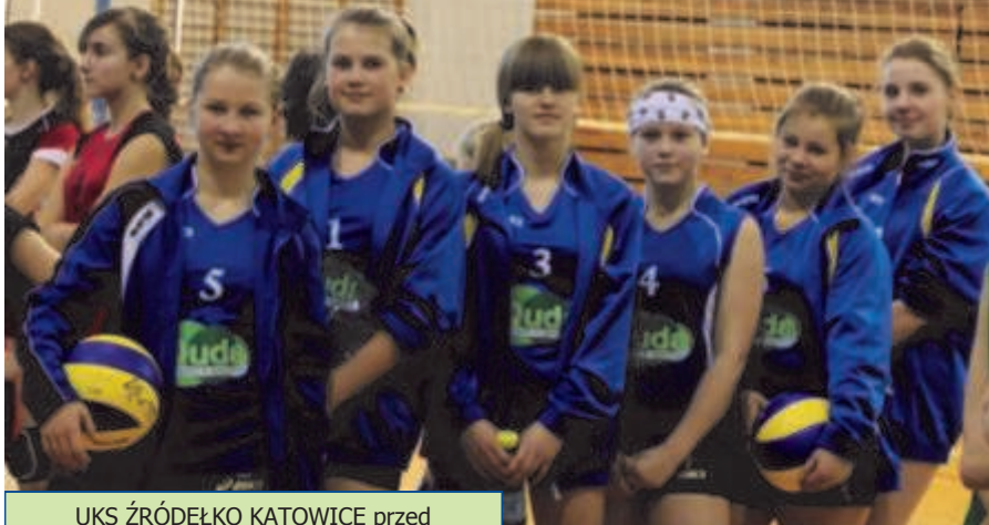
UKS ŹRÓDEŁKO KATOWICE przed rozpoczęciem turnieju w Mikołowie